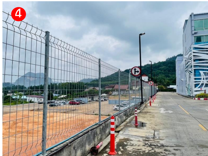
ทิศตะวันตก ติดกับพื้นที่จอดรถ ซึ่งเป็นที่ดินของโรงพยาบาล