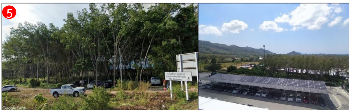
ทิศใต้ ติดกับ ที่ดินบุคคลอื่น ปัจจุบันเป็นสวนยางพารา