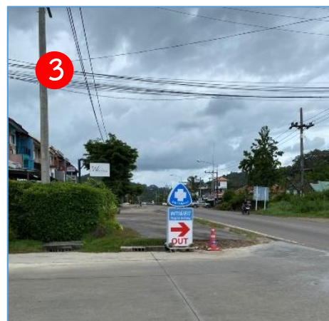
ทิศตะวันออก ติดกับ อาคารพาณิชย์ และทางหลวงแผ่นดินสายบ้านช่องพลี-หาดนพรัตน์ธารา (4202)